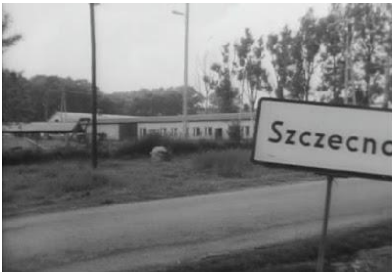
Rolnicza Spółdzielnia Produkcyjna w Szczecnie 1987 r.

Od 2007 roku Szkoła Podstawowa w Szczecnie jest prowadzona przez Stowarzyszenie Na Rzecz Rozwoju Szczecna, a zajęcia dydaktyczne odbywają się w zmodernizowanych budynkach po RSP Szczecno.