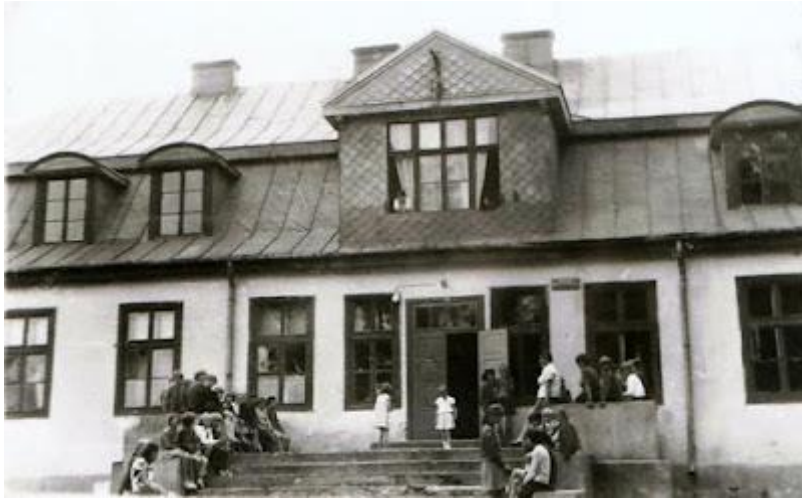
Szkoła w byłym dworze

Od 2007 roku Szkoła Podstawowa w Szczecnie jest prowadzona przez Stowarzyszenie Na Rzecz Rozwoju Szczecna, a zajęcia dydaktyczne odbywają się w zmodernizowanych budynkach po RSP Szczecno.