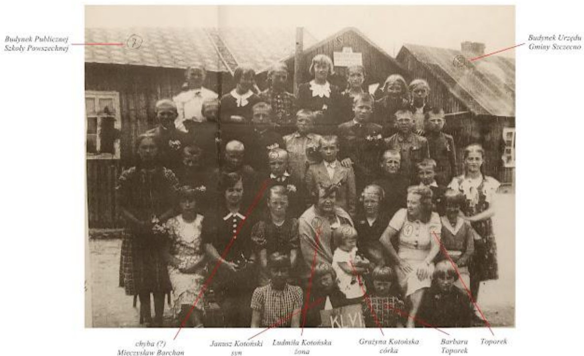
Przed budynkiem szkoły w 1939 r.