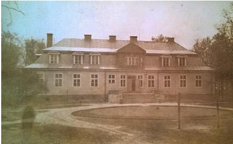
Budynek szkoły po II wojnie światowej

Po upadku Powstania Styczniowego 1863/64 nastąpił znaczący przyrost ilości nowo powstających szkół tzw. elementarnych na terenie Królestwa Polskiego. Na lata 1865-1867 przypada masowe otwieranie nowych szkół. Właśnie w 1867 r. powstała szkoła w Szczecnie . [1] Szkoły elementarne, zwłaszcza wiejskie były przez całą drugą połowę XIX wieku prawie całkowicie utrzymywane przez ludność miejscową. W związku jednak