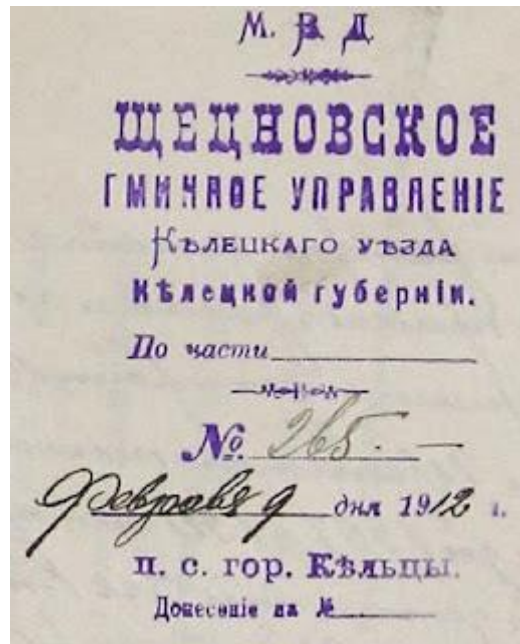
Szczeciński Urząd Gminy Kieleckiego Powiatu Kieleckiej Guberni